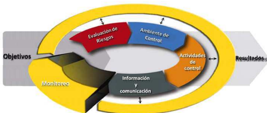
GRÁFICO N° 2 MONITOREO APLICADO AL PROCESO DE CONTROL INTERNO 2

3.10 Desde el punto de vista de quien lo efectúa, el MyE puede ser ejecutado: